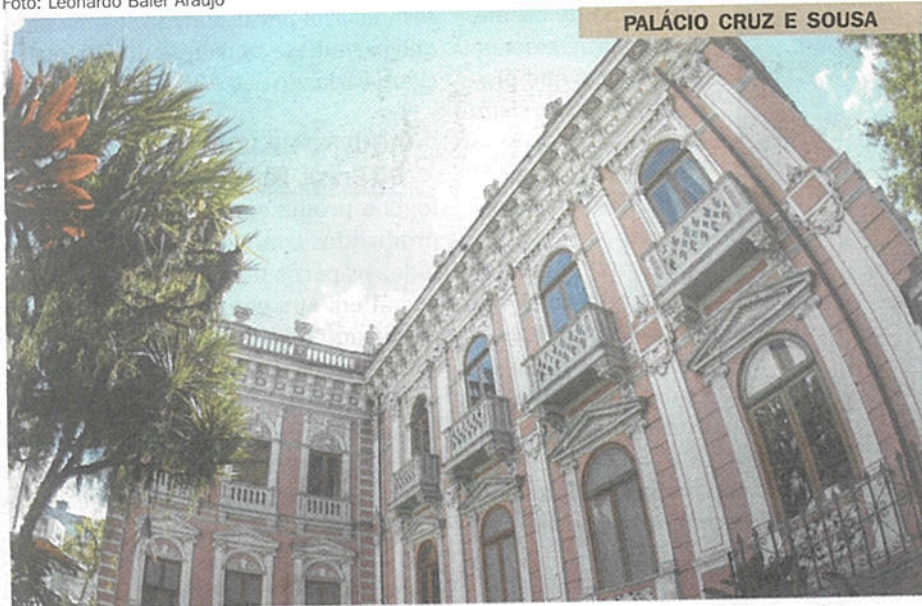
PALÁCIO CRUZ E SOUSA