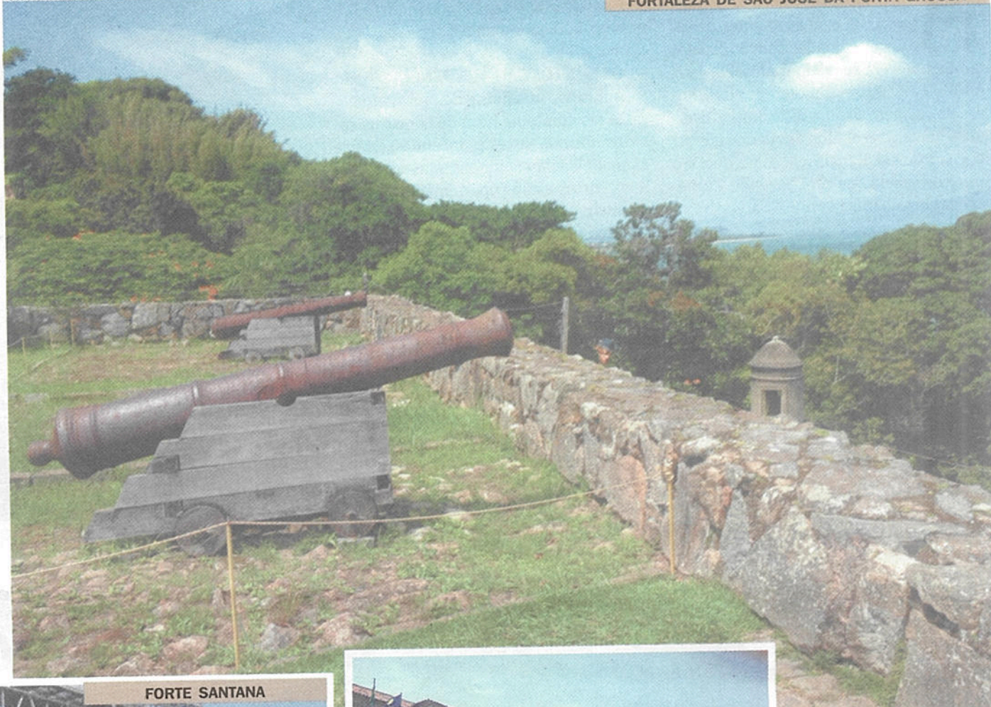
FORTALEZA DE SÃO JOSÉ DA PONTA GROSSA